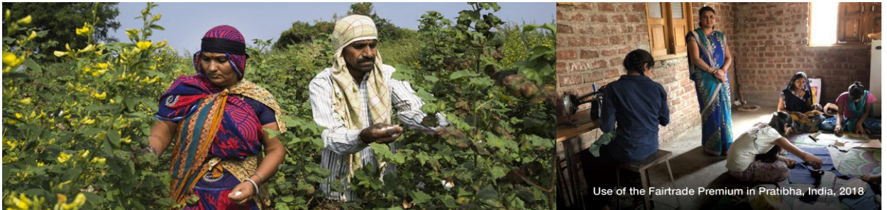
Use of the Fairtrade Premium in Pratibha, India, 2018

인도의 공정무역 인증 면화 생산자 조합 Partibha Vasuaha 는 전세계 최대의 섬유 제조 회사 중 하나인 Partibha Syntex와 협업하여 면화를 생산하고 있다.